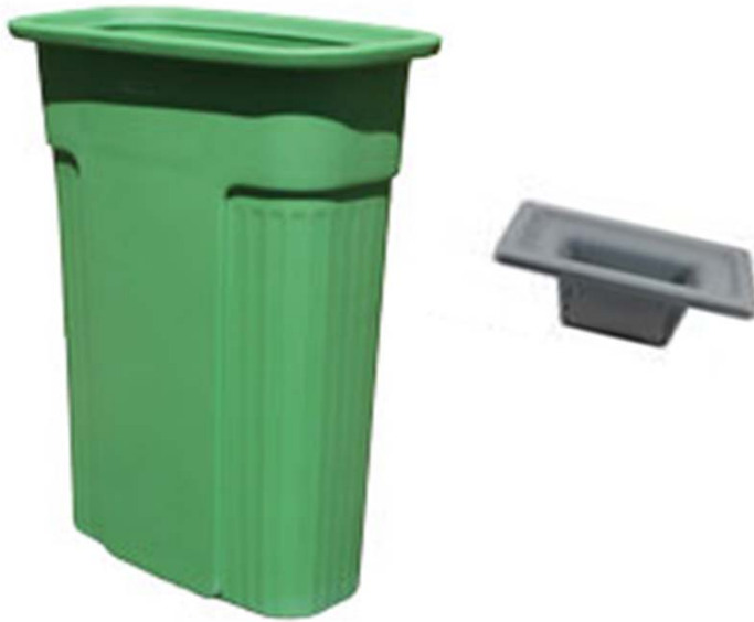
Green Slim Jim trash can with grey lid and food scraper

Plastic bin to capture contents emitted from machine